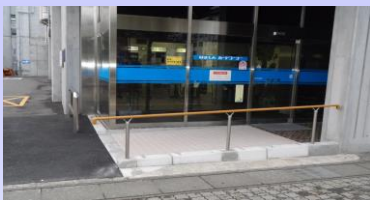
本店にスロープを設置しました。

ご高齢のお客様や障がいをお持ちのお客様、介添えをされるお客様に、安心してご来店いただける店作りを目指し、全営業店にお客様用「車いす」を設置(平成26年9月設置完了)いたしました。その他、ご高齢のお客様、障がいをお持ちのお客様への「おもてなし力向上」に関する主な取り組みとして、①認知症サポーター養成、②視覚障がい者対応ATMの設置(全ATM)、③筆談用ボード(全営業店)、④ATM、記帳台への杖立て設置(全営業店)、⑤障がい者用駐車場の設置(一部店舗除く)、⑥点字ブロック、店舗入口スロープ、「車いす」対応トイレ(新店舗、リニューアルに伴い順次設置中)、⑦音声標識ガイドシステム(一部店舗のみ)等の取り組みをしております。今後とも、お客様にご満足いただける店作りを職員一同目指してまいります。